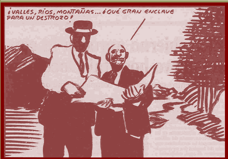
¡Valles, ríos montañas...¡Qué gran enclave para un destrozo! EL PAIS. 20 junio 2004. EL ROTO

http://www.nodo50.org/sierraoestedesarrollosostenible/