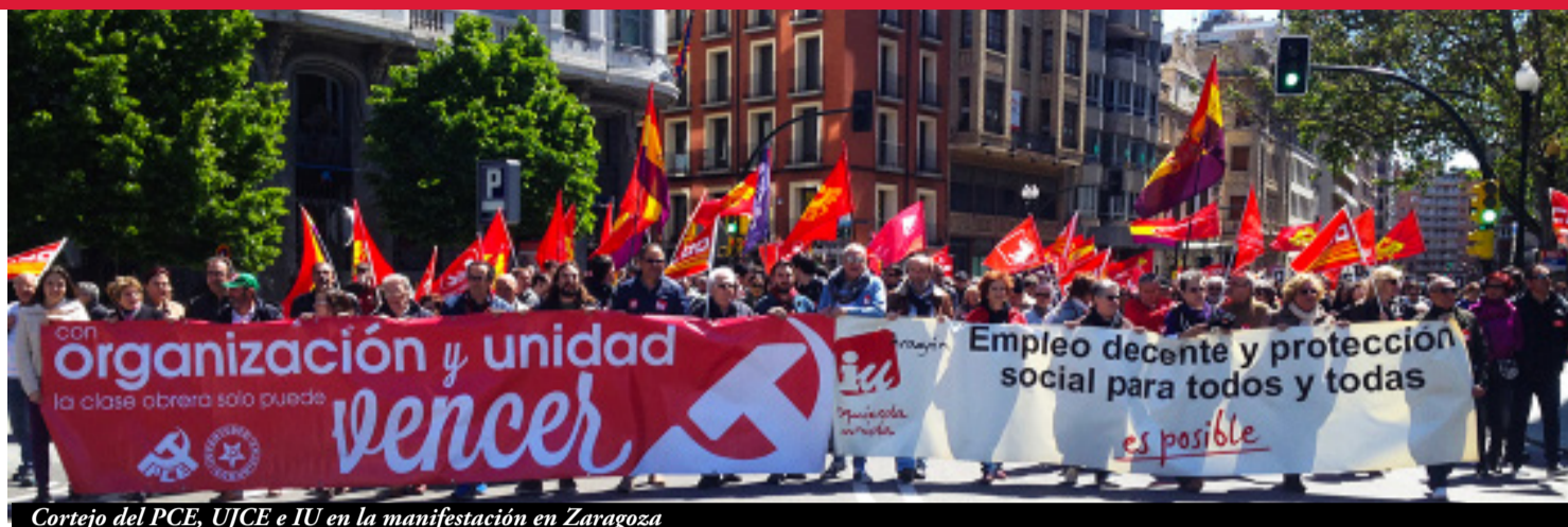
Cortejo del PCE, UJCE e IU en la manifestación en Zaragoza

dos nuestros convenios colectivos, por culpa de las reformas laborales que lo único que buscaban era el abaratamiento de los salarios, facilitar los despidos y los recortes en derechos, para beneficio del sistema capitalista. Somos los trabajado-