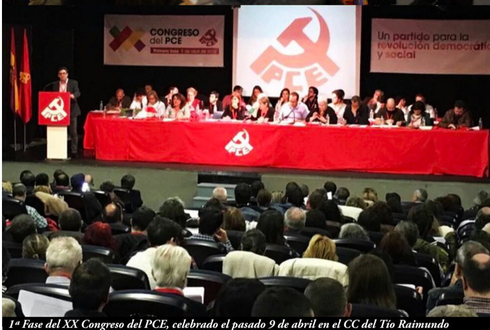
1ª Fase del XX Congreso del PCE, celebrado el pasado 9 de abril en el CC del Tío Raimundo

fiel reflejo de las deficiencias de género en cuestiones de representatividad y del gran camino que aún tenemos que recorrer hasta corregirlo). Debatimos, enmendamos y pusimos en común las cuestiones planteadas en las reuniones de las agrupaciones del PCE Aragón, y se presentaron varias resoluciones, que fueron aprobadas por unanimidad, sobre violencia machista, conflictos laborales en nuestra región y sobre el conflicto de la Limpieza de edificios y locales de Zaragoza.