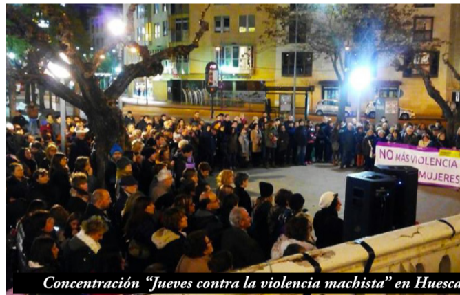
Concentración "Jueves contra la violencia machista" en Huesca

"Nos queremos vivas" las primeras Jornadas del Espacio Feminista de Teruel tuvieron lugar entre el 1 y el 4 de marzo y en el que realizaron charlas, debates, talleres, té con cuento, picoteo, fiesta... y la campaña "Cuerpos reales", como crítica y protesta contra los cánones de belleza establecidos por el sistema heteropatriarcal y muy alejados de la realidad, son las últimas actividades que han realizado.