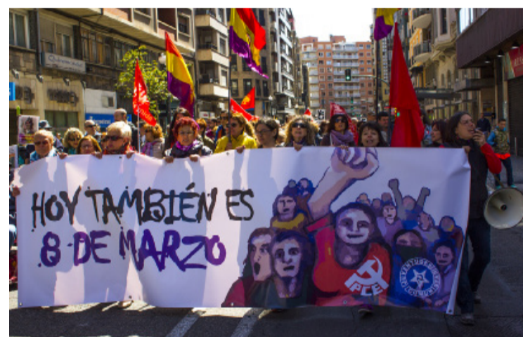
Cortejo y pancarta de la Sª de la Mujer en la manifestación de Zaragoza

¡Viva el 1º de Mayo! ¡Viva la lucha de la Clase Obrera!