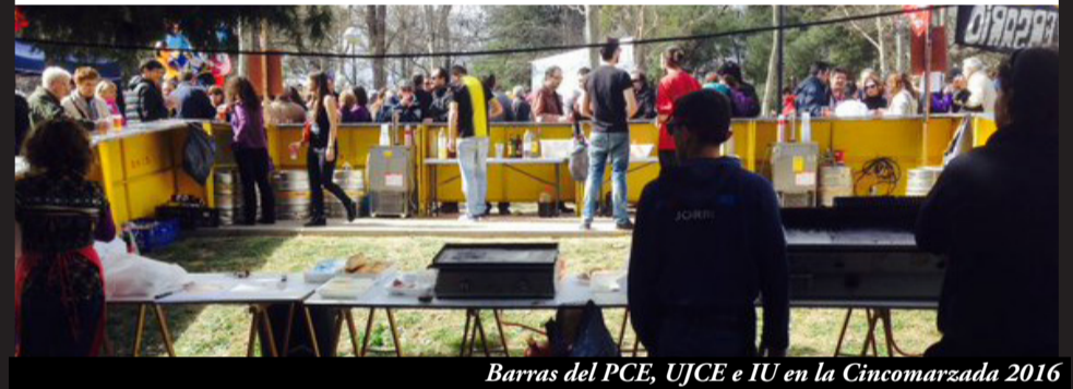
Barras del PCE, UJCE e IU en la Cincomarzada 2016

Como todo los años, el PCE, la UJCE e IU montamos stands y barra en la celebración de la Cincomarzada, organizada un año más por la Federación de Asociaciones de Barrios de Zaragoza (FABZ), en el Parque del Tío Jorge de Zaragoza, junto con muchos de los movimientos sociales y organizaciones populares y políticas de la ciudad.