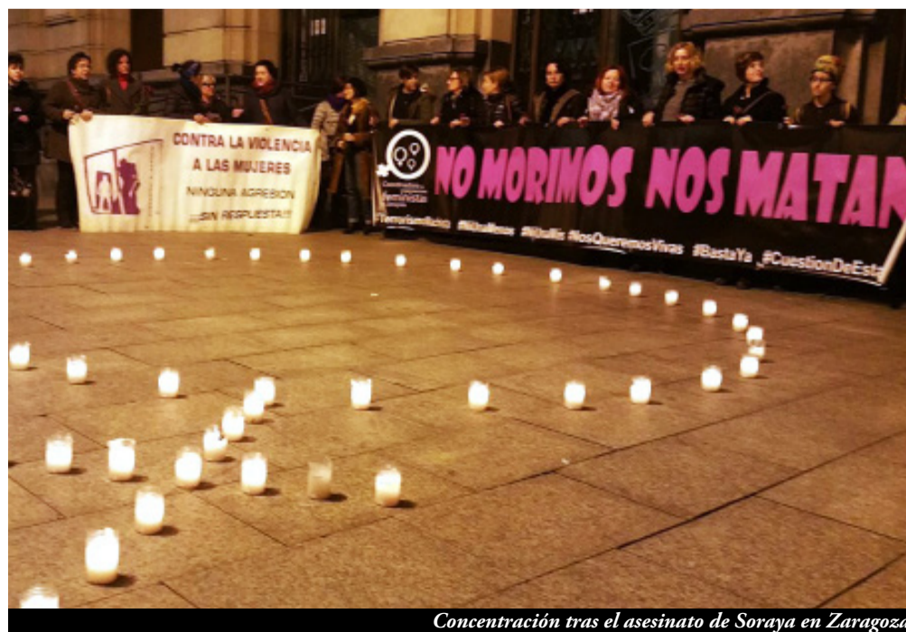
Concentración tras el asesinato de Soraya en Zaragoza