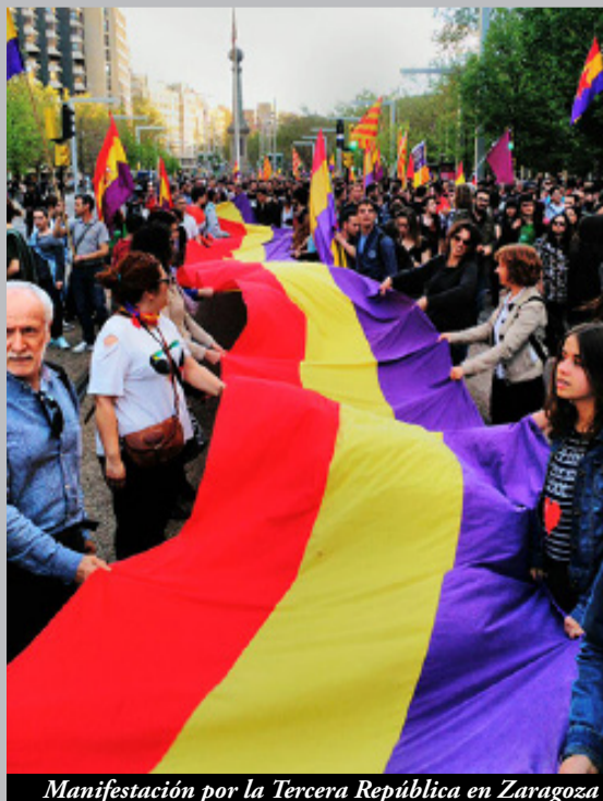
Manifestación por la Tercera República en Zaragoza

¡Democracia o monarquía! ¡Viva la República!