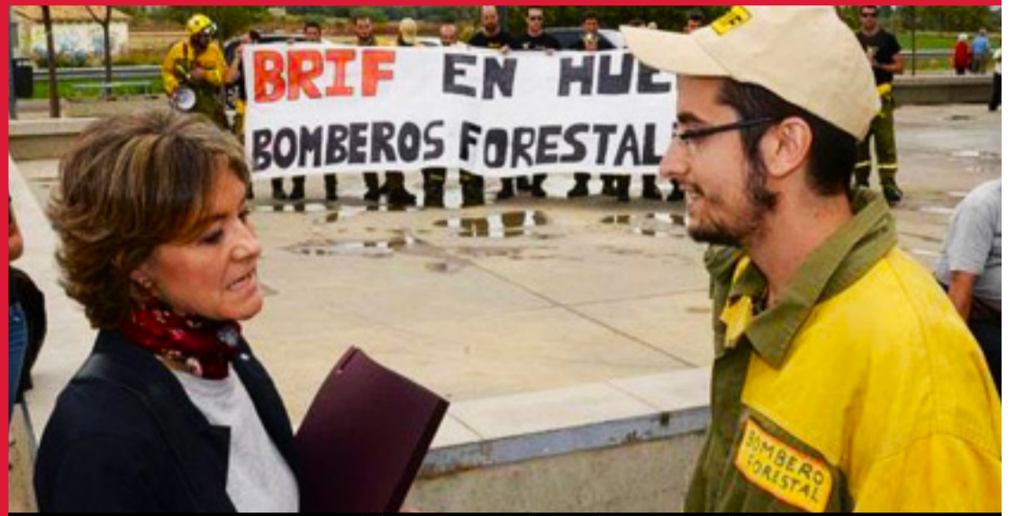
Protesta de la BRIF Daroca frente a la Ministra Isabel García Tejerina, en Huesca

Despedidas de Alcampo Utebo ¡Readmisión!