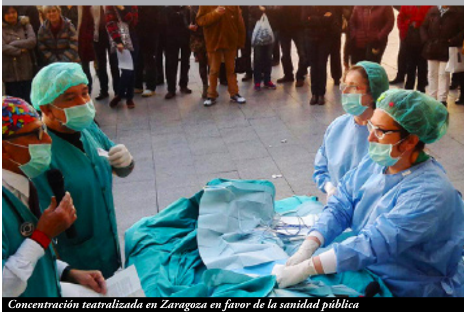
Concentración teatralizada en Zaragoza en favor de la sanidad pública

El jueves 7 de abril se celebró, en distintas ciudades europeas y españolas, la Jornada Europea de Acción contra la Mercantilización de la Sanidad. Fue una iniciativa en defensa de la sanidad pública amenazada en todos los países de la Unión Europea por las políticas de recortes del gasto público y privatizaciones que promueven las autoridades comunitarias (TROIKA) y por la futura firma de un Tratado para la Liberalización de los Servicios Públi-