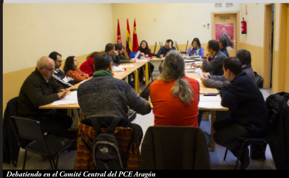
Debatiendo en el Comité Central del PCE Aragón

Las reuniones de la Comisión de IU sirven para organizar el trabajo en nuestros referentes institucionales, descentralizando y agilizando de esta forma el desarrollo de las reuniones del Comité Central, en el cual se informa de todos los ámbitos en los que participamos, trasladando las reuniones y debates federales y aplicando la máxima de que “las y los comunistas vamos organizados a todos los lugares donde colectivamente decidimos trabajar y participar”.