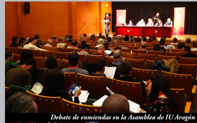
Debate de enmiendas en la Asamblea de IU Aragón

De esta manera y con la voluntad de que el documento "Por un nuevo País" sea sobre el que se construyan las síntesis en el debate asambleario, acordamos asumirlo; pero también subrayando que no estamos ante un Documento propiedad del PCE sino que es fruto de las aportaciones de muchos compañeros/as y plataformas que han participado en su debate, por lo que el resultado final debe reflejar toda esta pluralidad. Por eso, hacemos un llamamiento a conseguir la máxima síntesis y el mayor encuentro en la política.