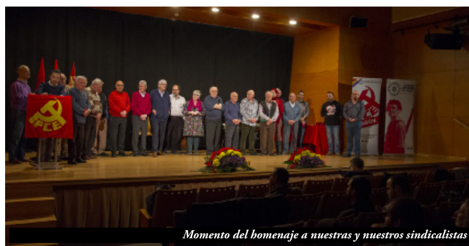
Momento del homenaje a nuestras y nuestros sindicalistas