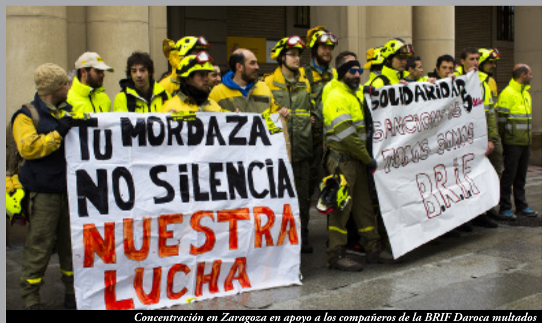
Concentración en Zaragoza en apoyo a los compañeros de la BRIF Daroca multados

Seguimos creyendo que la protección del medio rural debe ser atendida por personas dotadas con los mejores medios, tratados con los derechos laborales que deseamos para toda la Clase Obrera "de cada cual según sus capacidades, a cada cual según sus necesidades", y bajo el reconocimiento público adecuado a la labor social que